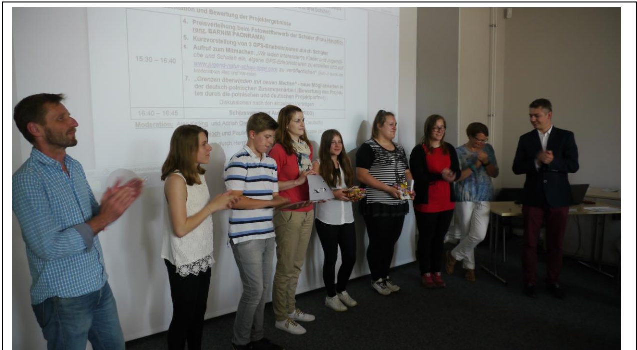
Abb. 8: Die Juri mit den glücklichen Gewinnerinnen aus Wittenberge und Pszczew (5. und 6. von links)