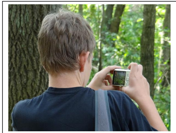
Abb. 1 - 6: Deutsche und polnische Schüler bei der Naturfotografie.