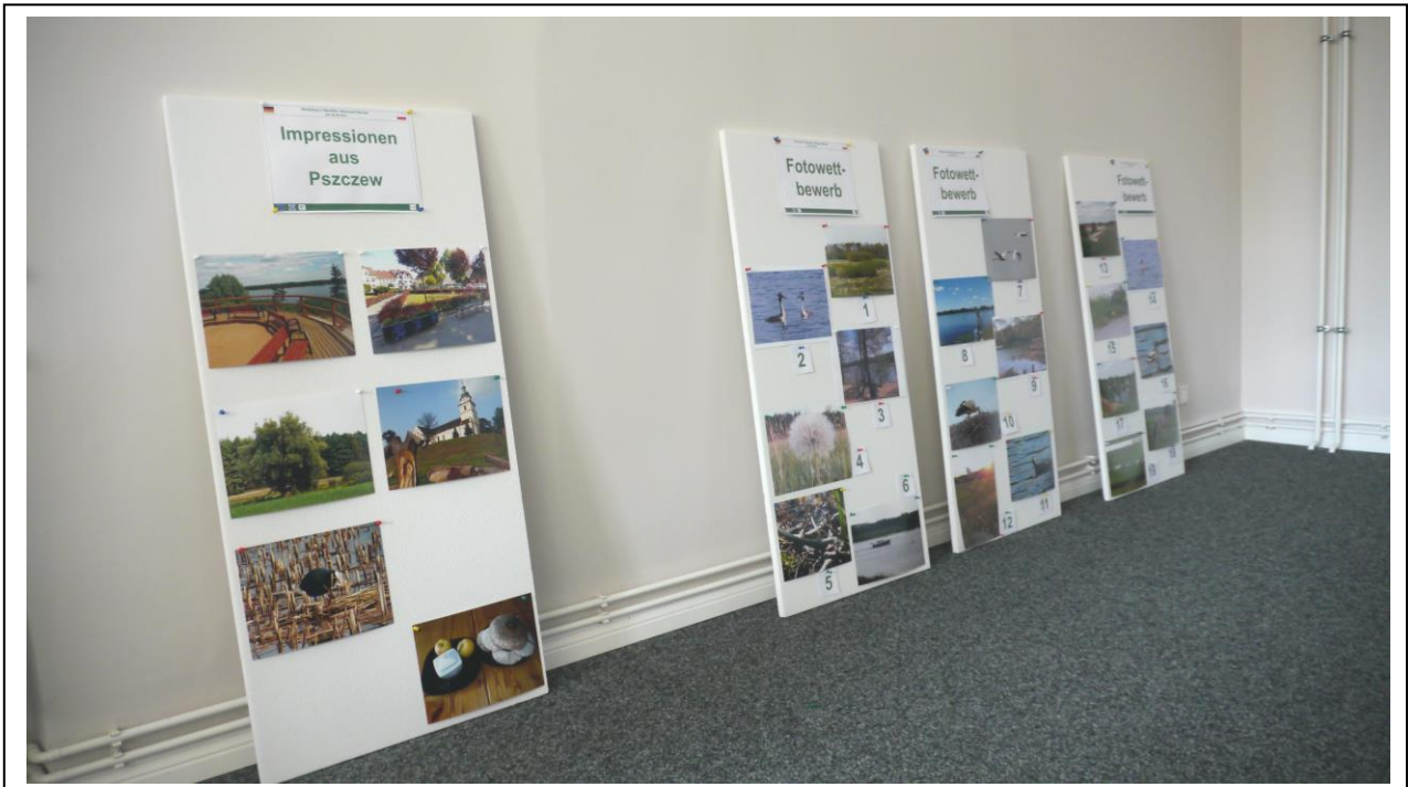
Abb. 7: Fotos, die zum Wettbewerb eingereicht wurden (rechte Tafeln)