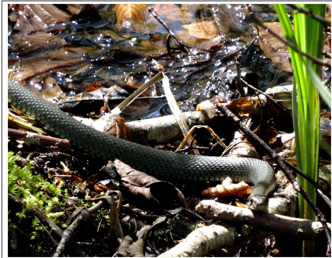
Abb. 11 - 12: Wettbewerbfotos aus dem Naturpark Barnim (Liepnitzsee)