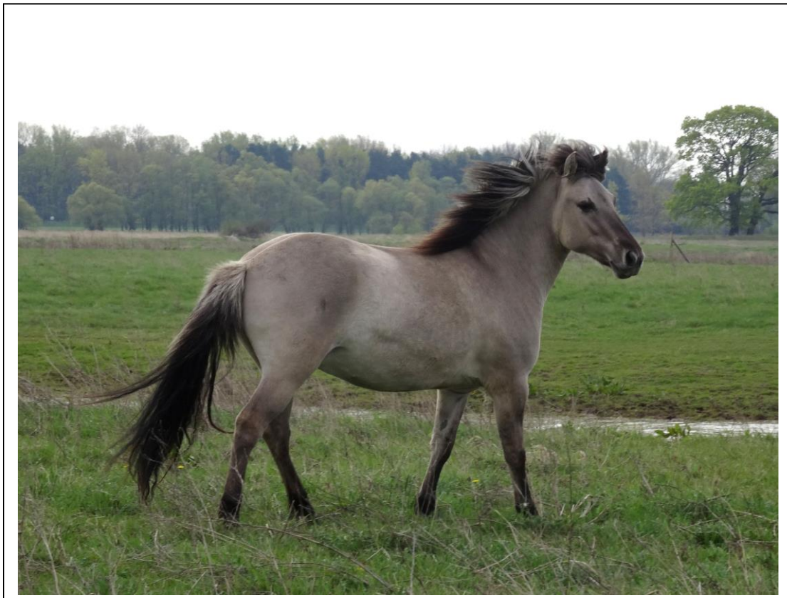
Abb. 9 - 10: Die Siegerfotos aus dem Biosphärenreservat Flusslandschaft Elbe Brandenburg